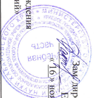
График проведения промежуточной аттестации обучающихся Краевого государственного бюджетного профессионального образовательного учреждения «Хабаровский техникум технологической безопасности и промышленных технологий» на первое полугодие 2023-2024 учебного года